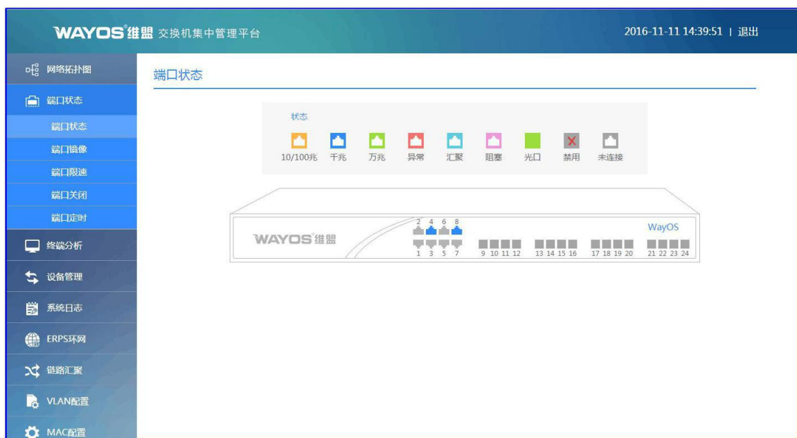
图为交换机集中管理平台界面

交换机联动是指维盟交换机（WS6015W）和维盟网关进行联动，交换机在运行过程中，将各种信息上报给维盟网关，维盟网关根据交换机上的信息以及自己收到数据报文进行分析检测，采取有针对性的动作，并将一些反应动作通过自定义的内部协发送到交换机上，从而由交换机来实现对设备的精确配置。